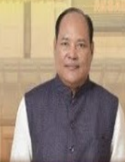
SRI BISWAJIT DAIMARY, Hon'ble Speaker, Assam Legislative Assembly

Date: 9 TH April, 2025 (Wednesday) Time: 10:00 AM Onwards